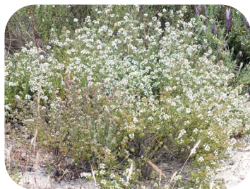
Tomilho ( Thymus vulgaris )

Lugar (es) de contemplação do mar, de observação da flora, como a camarinha ( Corema album L.), a perpétua-das-areias ( Helichrysum stoechas L.), o rosmarinho ( Lavandula luisieri L.) ou o tomilho ( Thymus vulgaris L.). É também um lugar de contemplação da paisagem, de partida e de inspiração para o Caminho das Artes.